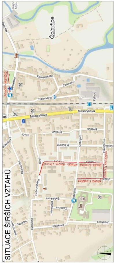
Obr. 1 – Situace dopravního značení