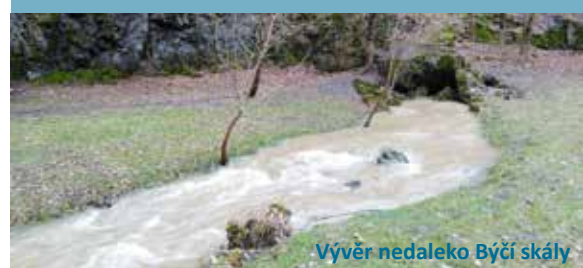
Vývěr nedaleko Býčí skály