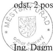
Ing. Dagmar Kratochvílová vedoucí odboru dopravy

Proti opatření obecné povahy, na základě ustanovení § 173 odst. 2 SŘ, nelze podat opravný prostředek. Soulad opatření obecné povahy s právními předpisy lze dle ustanovení § 174 odst. 2 posoudit v přezkumném řízení.