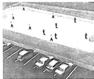
Návrh kluziště v Říčmanicích. Vizualizace: Roman Struhařík

Podle plánu bude mít ledová plocha rozměry čtyřiačtyřicet krát dvaadvacet metrů. „Přejeme si, aby kluziště i hřiště využívaly školy