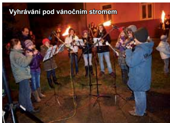
Vyhrávání pod vánočním stromem