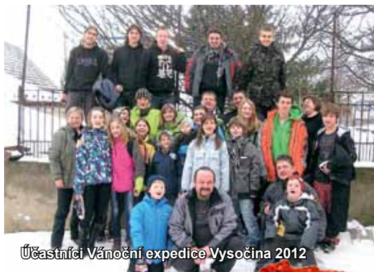
Účastníci Vánoční expedice Vysočina 2012

RAJHRADSKÝ ZPRAVODAJ • Informace o dění ve městě Rajhrad • 22. ročník • Vydavatel: město Rajhrad, Masarykova 32, 664 61 Rajhrad, www.rajhrad.cz • Redakční rada: Bc. Roman Svora – předseda, PhDr. Dagmar Malotová, Lada Hameríková, podatelna@rajhrad.cz • Redaktor: Petr Žižka, zpravodaj@rajhrad.cz • Grafické zpracování: Roman Halouzka, CGS – reklamní studio, www.ReklamaProVas.cz • Uzávěrka 15. dne předcházejícího měsíce • Vychází zdarma každý sudý měsíc • Náklad 1 300 kusů • Nevyžádané rukopisy a přílohy se nevracejí • Registrační číslo MK ČR E 10274