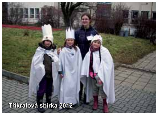
Tříkrálová sbírka 2012