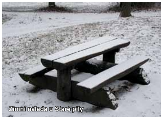
Zimní nálada u Staré pily