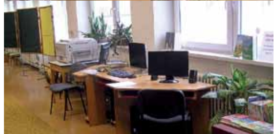
Knihovna v roce 2012