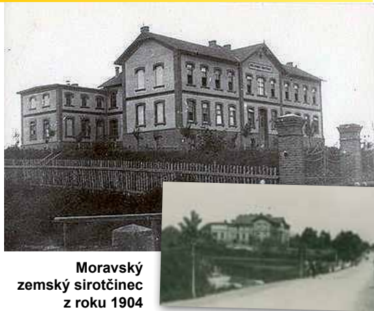
Moravský zemský sirotčinec z roku 1904

Škola, která ve své historii připravila řadu zahradnický vzdělaných odborníků, otevřela 1. září 2011 novou školní budovu, ve které po jednoroční přestávce připravila kouzelnou vánoční výstavu. Areál školy se rozšířil o nový, architektonicky krásný objekt. Co však o celém areálu školy víme?