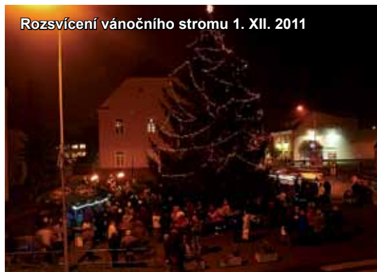
Rozsvícení vánočního stromu 1. XII. 2011