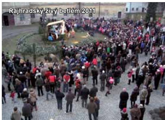
Rajhradský živý betlém 2011