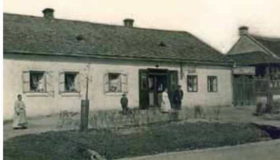
Dům č. 41 (foto z 20. let minulého století)

Ve druhé polovině 17. století byla postavena na místě domu č.41 školní budova. Měla dvě místnosti. V jedné bydlel a učil učitel, druhá místnost sloužila hrobaři, který v ní přechovával nemocné a pceestné. V letech 1665–1680 vyučoval v této škole Jakub Štěpánek. V budově se učilo až do roku 1752, kdy budova vyhořela. Bylo to v době učitelování Kašpara Stodka, který se (asi pod vlivem nešťastného požáru) z Rajhradu odstěhoval. Škola zůstala po téměř 16 let v rozvalinách, učilo se přechodně na čísle 46 (dnes malé parkoviště vedle stolařství Fajstl+Tauvinkl). V roce 1768 bylo rozhodnuto obnovit školu na původním místě, tedy na č. 41. Vyučování bylo zahájeno 17. září téhož roku. V nově postavené budově se učilo až do roku 1790. Počet žáků se neustále zvětšoval, přicházeli i žáci z okolních obcí a škola se tereziánskými zákony měnila. Obec tuto situaci řešila přeložením školy do areálu kláštera (dnes byty na prvním klášterním nádvoří). Tímto aktem končí „školní služba“ domu č. 41.