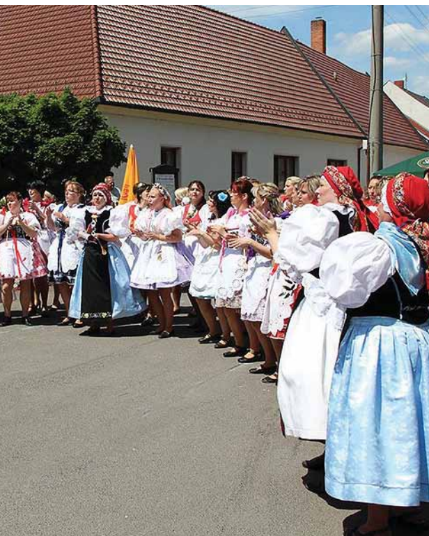
Čeká se na zahájení hodů

(za jezdcem jdou dámy v Rajhradských krojích)