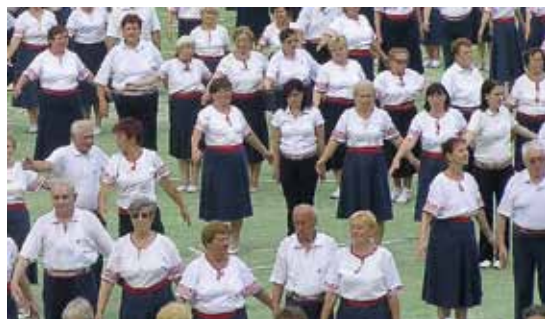
Cvičky Věrné gardy Sokola Rajhrad (čtvrtá řada)