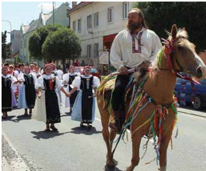
Čelo průvodu Babských hodů

(za jezdcem jdou dámy v Rajhradských krojích)