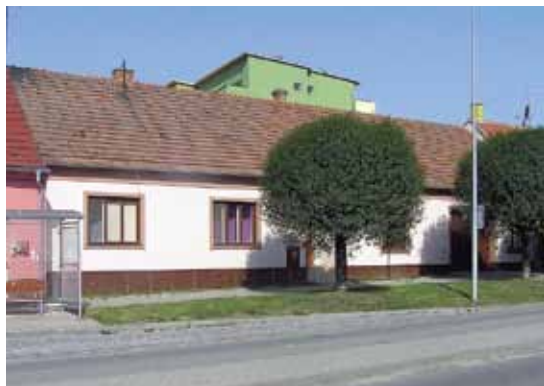
Dům č. 41 (současný stav)