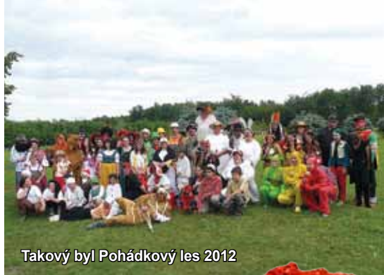
Takový byl Pohádkový les 2012

RAJHRADSKÝ ZPRAVODAJ • Informace o dění ve městě Rajhrad • 22. ročník • Vydavatel: město Rajhrad, Masarykova 32, 664 61 Rajhrad, www.rajhrad.cz • Redakční rada: Bc. Roman Svora – předseda, PhDr. Dagmar Malotová, Lada Hameriková, podatelna@rajhrad.cz • Redaktor: Petr Žižka, zpravodaj@rajhrad.cz • Grafické zpracování: Roman Halouzka, CGS – reklamní studio, www.ReklamaProVas.cz • Uzávěrka 15. dne předcházejícího měsíce • Vychází zdarma každý sudý měsíc • Náklad 1 300 kusů • Nevyžádané rukopisy a přílohy se nevracejí • Registrační číslo MK ČR E 10274