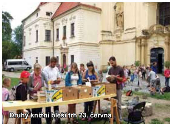
Druhý knižní bleší trh 23. června