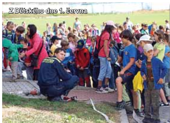
Z Dětského dne 1. června