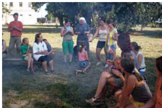
Tradiční „ŠPEKÁČKY“ na začátku každé sezóny

U nových zpěváků či hudebníků se nekonají žádné přijímačky, přesto tři požadavky na zájemce máme: chuť zpívat nebo hrát, nebýt úplně hudebně hluchý a pravidelně se účastnit zkoušek sboru. Jestliže tyto požadavky splňujete, buďte vítáni. Máte-li chuť zapojit se svým zpěvem, popřípadě hrou na hudební nástroj do naší činnosti, napište nám na naši e-mailovou adresu ( magdam1@seznam.cz , hadsam@seznam.cz ), další informace získáte na našich letáčcích nebo na sborové nástěnce v Rajhradě.