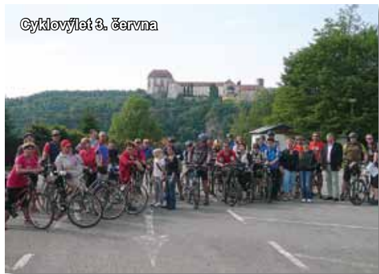
Cyklusový let 3. června