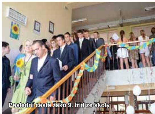
Poslední cesta žáků 9. tříd ze školy