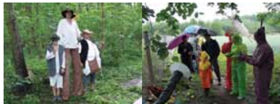
Dlouhý, Široký a Bystrozraky

Týden příprav na Pohádkový les 2012, pořádaný podeváté Občanským sdružením Kalamajka Rajhrad, byl mírně ovlivněn obavami z deštivého počasí. Navíc v pátek před akcí lilo snad celý den. Organizátorů se dotazovali různí lidé, zda nebude pohádkový les zrušen. Od sobotního rána se Rajhradská bažantnice zabývala pohádkovými bytostmi, ovšem stále za deště. Před polednem se ozval pan hajný, byl překvapený, že jsme všichni připraveni akci pro děti uskutečnit. Bylo neuvěřitelné, že se počasí umínilo, dokonce vysvitlo slunce, a co nás překvapilo nejvíc, že do mokrého a rozbláceného lesa přišlo na 500 lidí, dobře vybavených pláštěnkami, deštníky, obutí do gumáků, kočárky zabalené do speciálních fólií či pláštěnek, prostě přišli ti, co se nezalekli nepřízně přírody a na pohádky se těšili. Pro účinkující byl tento počet návštěvníků proti loňskému 1200 naprosto vyhovující, protože se mohli všem dětem i jejich doprovodům báječně věnovat. Tento les byl po této stránce vyhodnocen organizátory jako nejlepší ze všech předcházejících. Také děti si to nadmíru užily, protože kdy jindy mohly skákat do kalužin, řapat si v blátě a vůbec běhat a různě vyvádět v deštivém lese. Navíc přijeli nečekaně i koníčky s panem Janem Šťastným, za což Kalamajka velmi děkuje, stejně jako všem, kteří jakkoliv s organizací Pohádkového lesa Rajhrad 2012 pomohli.