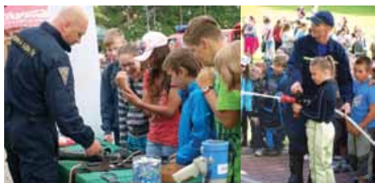
Takový byl Dětský den 1. června

V pátek 1. června uspořádalo Město Rajhrad pro naše žáky velmi zdařilý Dětský den s bohatým programem. Vystoupení jednotek Vězeňské služby ČR Věznice Rapotice, Celního ředitelství Brno, Krajského ředitelství policie, Hasičského záchranného sboru Jihomoravského kraje a Sboru dobrovolných hasičů Holasice bylo pro naše žáky velmi zajímavé a poučné. Za přípravu této organizačně náročné akce zástupcům města děkujeme.