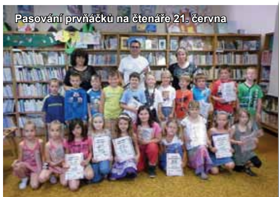
Pasování prvňáčků na čtenáře 21. června