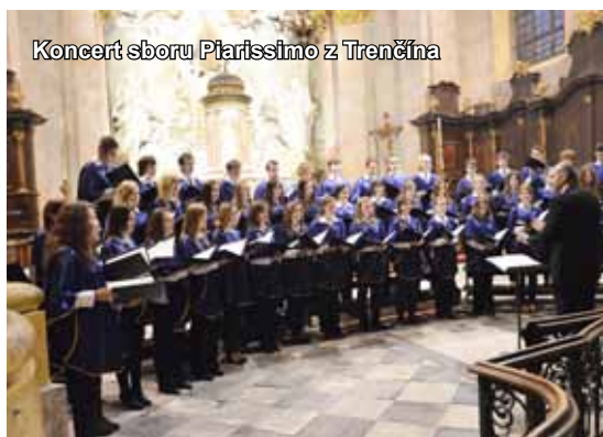
Koncert sboru Piarissimo z Trenčína