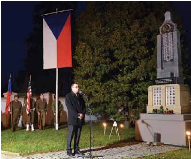
Zahájení pietního aktu

Kluby vojenské historie pořádají ve spolupráci s Městem Rajhrad