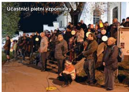
Účastníci pietní vzpomínky