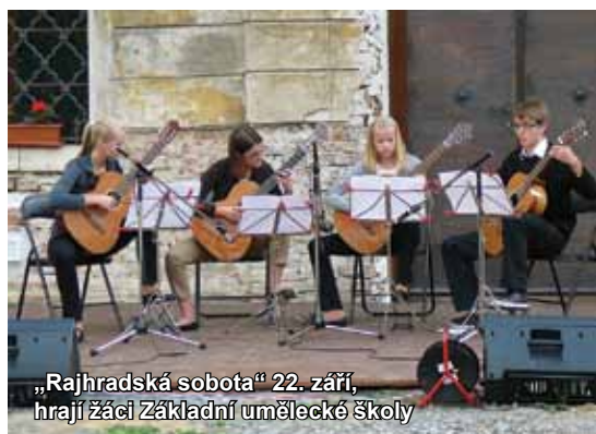
„Rajhradská sobota“ 22. září, hrají žáci Základní umělecké školy