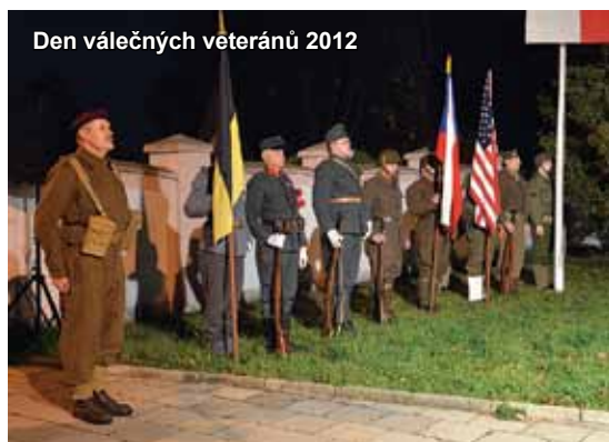
Den válečných veteránů 2012