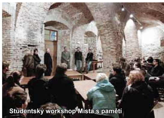
Studentský workshop Místa s pamětí