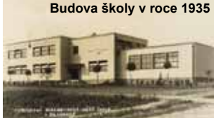
Budova školy v roce 1935