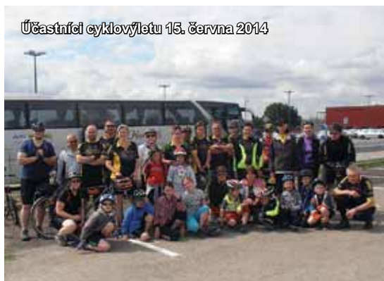
Účastníci cyklovýletu 15. června 2014