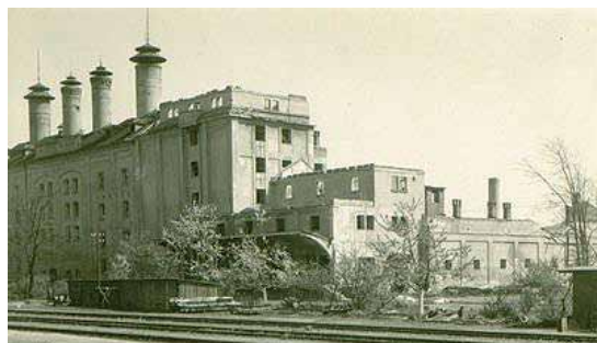
Sladovna v dubnu 1945

Archivní záznamy sladovny ze třicátých let minulého století podávají svědectví o čilém obchodním ruchu, dozvídáme se zajímavé číselné údaje z výroby sladu a sledujeme také nemalé problémy, které musela v době hospodářské krize sladovna překonávat. Sladovna byla ve spojení s Francií, Belgií, Holandskem, Švýcarskem, Itálií, Rakouskem a snažila se proniknout do států Severní Ameriky.