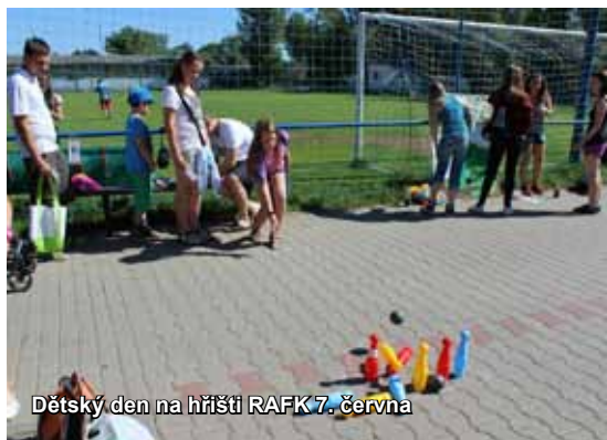
Dětský den na hřišti RAFK 7. června