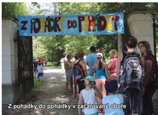
Z pohádky do pohádky v začarované oboře