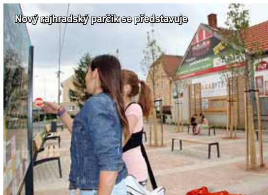
Nový rajhradský parčík se představuje

RAJHRADSKÝ ZPRAVODAJ • Informace o dění ve městě Rajhrad • 24. ročník • Vydavatel: město Rajhrad, Masarykova 32, 664 61 Rajhrad, www.rajhrad.cz • Redakční rada: Bc. Roman Svora – předseda, PhDr. Dagmar Malotová, Lada Hamerníková, podatelna@rajhrad.cz • Redaktor: Petr Žižka, zpravodaj@rajhrad.cz • Grafické zpracování: Roman Halouzka, CGS – reklamní studio, www.ReklamaProVas.cz • Uzávěrka 15. dne předcházejícího měsíce • Vychází zdarma každý měsíc • Náklad 1 350 kusů • Nevyžádané rukopisy a přílohy se nevracejí • Registrační číslo MK ČR E 10274