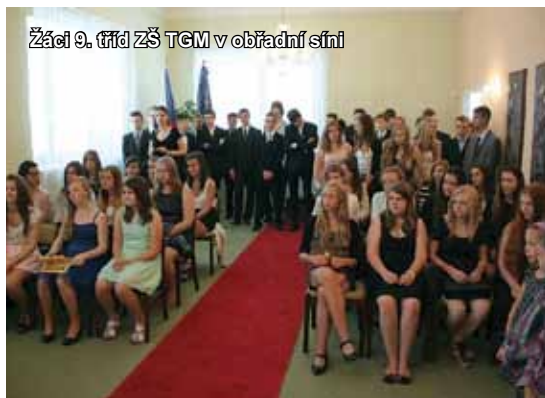
Žáci 9. tříd ZŠ TGM v obřadní síni