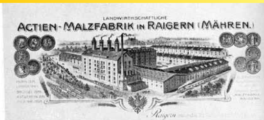
Rajhradská s'adovna v z'ahrafi jejího obchodního tiskopisu z počátku 20. století