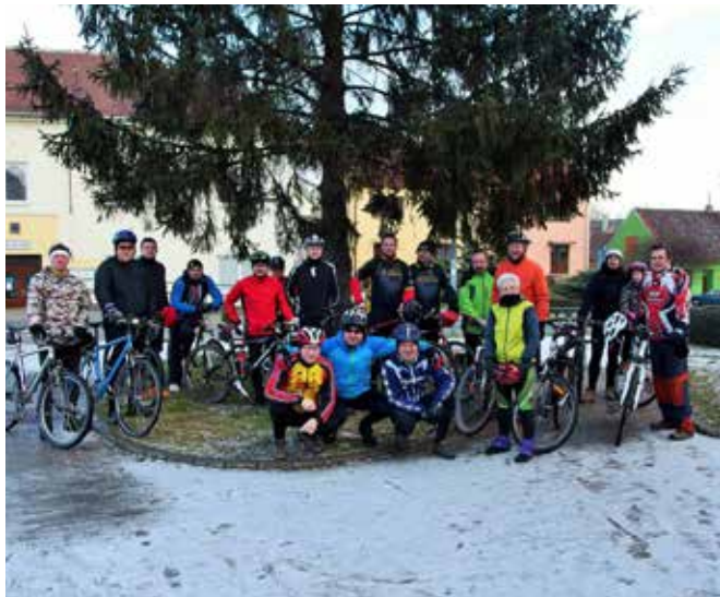
Účastníci novoroční cyklovýjžd'ky

Město Rajhrad zve všechny zdatné příznivce cyklistiky na akci: