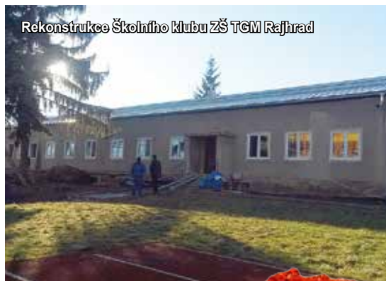
Rekonstrukce Školního klubu ZŠ TCM Rajhrad

RAJHRADSKÝ ZPRAVODAJ • Informace o dění ve městě Rajhrad • 25. ročník • Vydavatel: město Rajhrad, Masarykova 32, 664 61 Rajhrad, www.rajhrad.cz • Redakční rada: předsedkyně PhDr. Dagmar Malotová, členové Lada Hamerníková, Ing. Jiří Milek, podatelna@rajhrad.cz , redaktor Petr Žižka, zpravodaj@rajhrad.cz • Grafické zpracování: Roman Halouzka, CGS – reklamní studio, www.ReklamaProVas.cz • Uzávěrka 15. dne předcházejícího měsíce • Vychází zdarma každý sudý měsíc • Náklad 1 450 kusů • Nevyžádané rukopisy a přílohy se nevracejí • Registrační číslo MK ČR E 10274