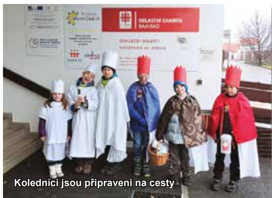
Koledníci jsou připraveni na cestu