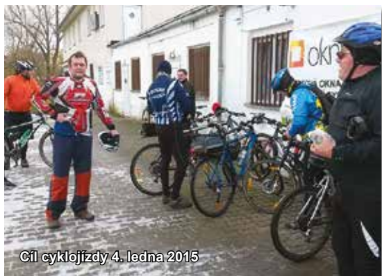
Cíl cyklojízdy 4. ledna 2015