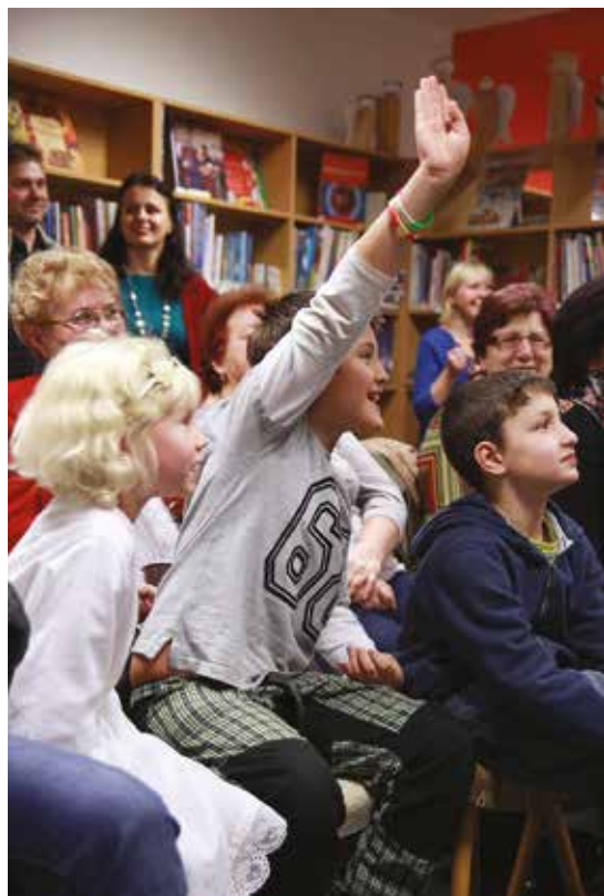
Dražba andělských marmelád

Podrobný rozpis a výsledky obou akcí (andělů i marmelád) najdete na nástěnce a webu knihovny www.knihovnarajhrad.webnode.cz