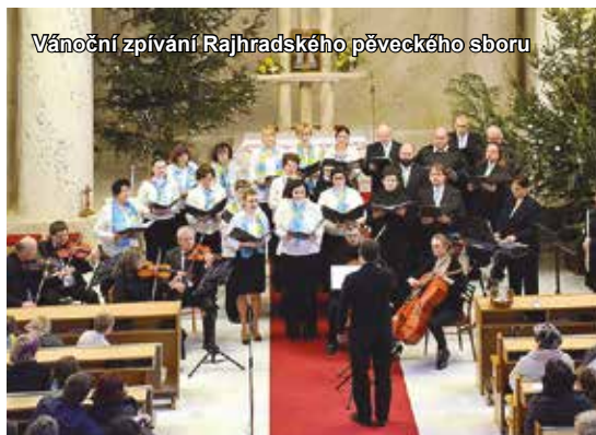
Vánoční zpívání Rajhradského pěveckého sboru