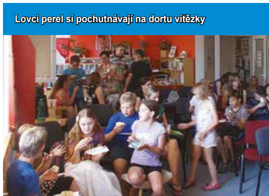
Lovci perel si pochutnávají na dortu vítězky