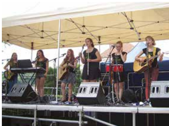
Kapela ŠREK na pódiu

Školní folková skupina ŠREK (Školní rajhradská elitní kapela) vystoupila na hudební přehlídce Evropský svátek hudby Brno 2016. Vystoupení proběhlo 21. června 2016 v Denisových sadech v Brně a zařadilo se k nejvydařenějším produkcím kapely za celý školní rok 2015/2016. Holky z kapely získaly další zkušenosti a mohly si vyzkoušet hraní na jednu z nejlepších aparatur v Brně, vyšlo i počasí a akce se tedy vydařila po všech stránkách.