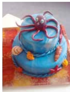
Cena pro vítěze

drobné přestupky. Nejčastěji do ní byli vsazováni poddaní, kteří si pustili pusy na špacír a rebelovali proti vrchnosti, klevetili či vedli opzlé řeči... Kuriózním trestem s mládencem. Zajímavá byla také svatojiřská tradice obcházení hraničních kamenů, kdy nalehnuvší noví sousedé a mladí hospodáři dostali výplatu na zadnici, aby si pamatovali, kudy vede hranice. Někteří posluchači projevili názor, že by nebylo od věci obě tyto tradice (trdlice a hraniční kopy) opět uvést do života... Po poutavém vyprávění se malé i větší čtenářky mohly potěšit tanečním vystoupením Dominika Damborského ve stylu street dance.