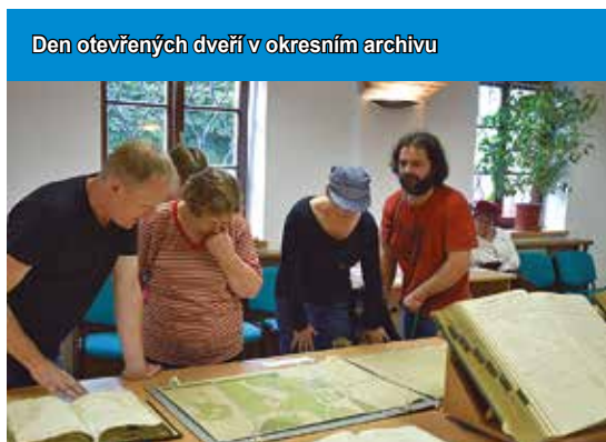
Den otevřených dveří v okresním archivu