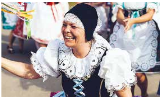
Babské hody 2016