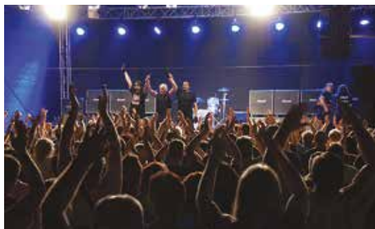
Legendární skupina Katapult v Rajhradě