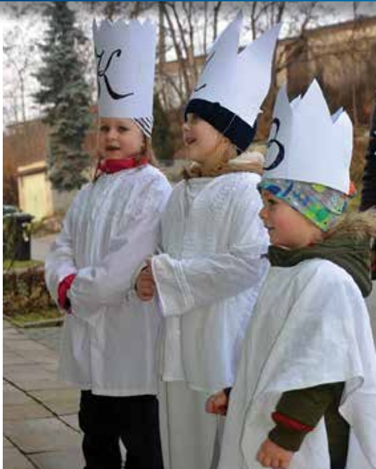
Děti krásně zaspívaly

Koledování je krásná tradice, kterou se v našem regionu daří udržovat díky organizaci Oblastní charity Rajhrad. Tři králové navštěvují domácnosti, zvěstují slovo o narození Páně a žehnají příbytkům a jejich obyvatelům.