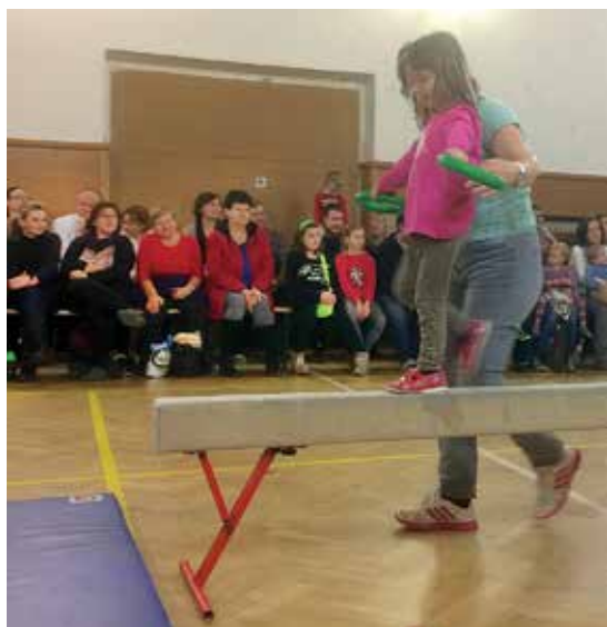
Veřejné cvičení při Mikulášské besidce

Sál rajhradské sokolovny je během roku plně využíván po celý týden. Máme několik oddílů dospělých, kteří se věnují různým pohybovým aktivitám. Samozřejmě evidujeme i dětskou členskou základnu. Ti nejmenší navštěvují hodiny společně se svými rodiči, příp. prarodiči (věk. kategorie do 4 let). Následně děti už samostatně objevují formou her, krok za krokem, cvičební nářadí a náčiní v oddíle předškoláků (věk. rozpětí 5–6 let, chlapci a děvčata). Poté pokračují ve cvičebních aktivitách věkově oddělení jako mladší žáci, starší žáci, mladší žákyně a starší žákyně. Pro mladší děti a chlapce máme díky dlouholetým obětavým cvičitelům vedení hodin zajištěno, bohužel tomu tak není u děvčat. Pokud by se mezi vámi našly nadšené maminky, tety či babičky, které by věnovaly svůj čas nejen svým dětem a rozšířily by tak naši cvičitelskou základnu, prosím kontaktujte nás: tjsokolrajhrad.webnode.cz