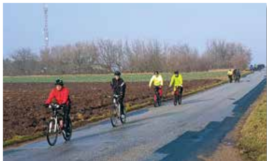
Cyklisti na trati