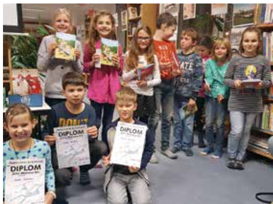
Soutěžící a ocenění střední kategorie od 7 do 10 let