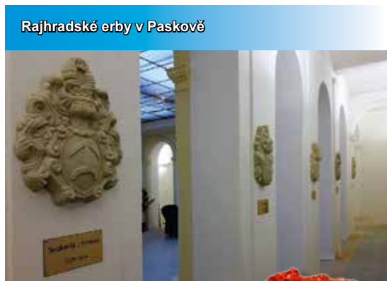
Rajhradské erby v Paskově

RAJHRADSKÝ ZPRAVODAJ • Informace o dění ve městě Rajhrad • 28. ročník • Vydavatel: Město Rajhrad, Masarykova 32, 664 61 Rajhrad, www.rajhrad.cz • Redakční rada: předsedkyně PhDr. Dagmar Malotová, členové Lada Hamerníková, Ing. Jiří Milek, mesto@rajhrad.cz , redaktor Mgr. Ivo Durec, zpravodaj@rajhrad.cz • Grafické zpracování: Roman Halouzka, CGS – reklamní studio, www.ReklamaProVas.cz • Uzávěrka 15. dne předcházejícího měsíce • Vychází zdarma každý sudý měsíc • Náklad 1 450 kusů • Nevyžádané rukopisy a přílohy se nevracejí • Registrační číslo MK ČR E 10274 • Zveřejňujeme redakční příspěvky, které neobsahují komerční sdělení a jsou dodány dle platných pravidel redakce.