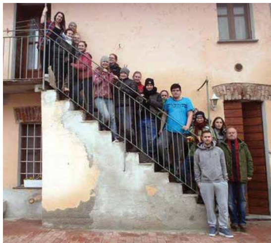
Studenti v Itálii

Žáci získali mnoho cenných pracovních zkušeností. Seznámili se s prostředím ekofarmy a s technologickými postupy používanými při pěstování bio potravin. Vyzkoušeli si práci v zeleninářské zahradě i v sadu. Pomáhali v lese při získávání paliva na zimu. Prováděli nátěry stromků a také mnoho nových stromků vysázeli. Největší zájem měli o práci se zvířaty. Seznámili se také se systémem třídění odpadu na farmě.