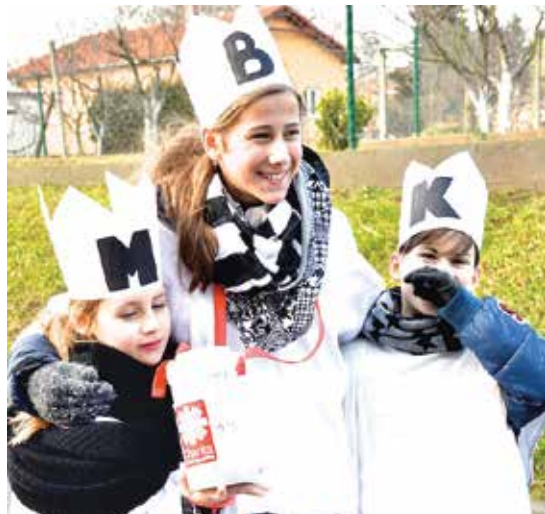
Milí koledníci pomáhají potřebným