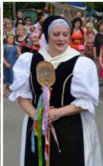
Pan starosta uděluje Hodovní právo