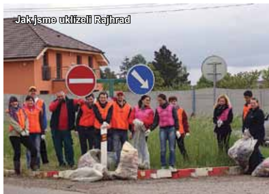
Jak jsme uklízeli Rajhrad