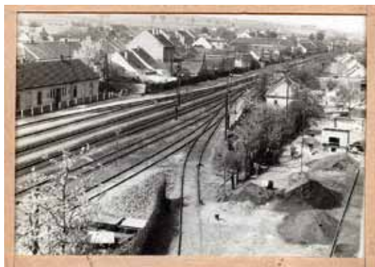
Kolejiště rajhradského nádraží

ným razítkem. Po dokončení elektrifikace trati v roce 1967 projel Rajhradem první vlak tažený elektrickou lokomotivou. V letech 1984–1987 bylo vybudováno nové zabezpečovací zařízení. Poslední modernizace 1. železničního koridoru změnila rajhradské nádraží k nepoznání. Bohaté kolejiště zmizelo a Rajhrad se stal zastávkou. Na místě někdejších skladišť je dnes vybudováno autobusové nádraží.