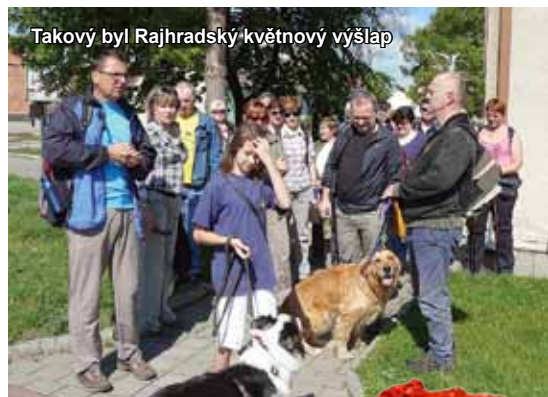
Takový byl Rajhradský květnový výšlap

RAJHRADSKÝ ZPRAVODAJ • Informace o dění ve městě Rajhrad • 24. ročník • Vydavatel: město Rajhrad, Masarykova 32, 664 61 Rajhrad, www.rajhrad.cz • Redakční rada: Bc. Roman Svora – předseda, PhDr. Dagmar Malotová, Lada Hamerníková, podatelna@rajhrad.cz • Redaktor: Petr Žižka, zpravodaj@rajhrad.cz • Grafické zpracování: Roman Halouzka, CGS – reklamní studio, www.ReklamaProVas.cz • Uzávěrka 15. dne předcházejícího měsíce • Vychází zdarma každý sudý měsíc • Náklad 1 350 kusů • Nevyžádané rukopisy a přílohy se nevracejí • Registrační číslo MK ČR E 10274