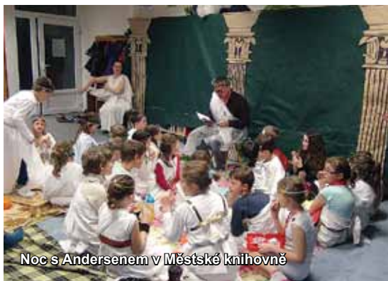
Noc s Andersenem v Městské knihovně