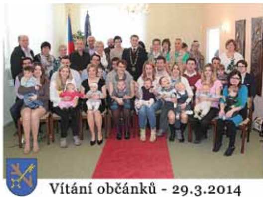
Vítání občánků - 29.3.2014