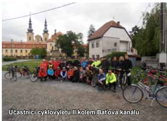
Účastníci cyklovýletu II kolem Bařova kanálu