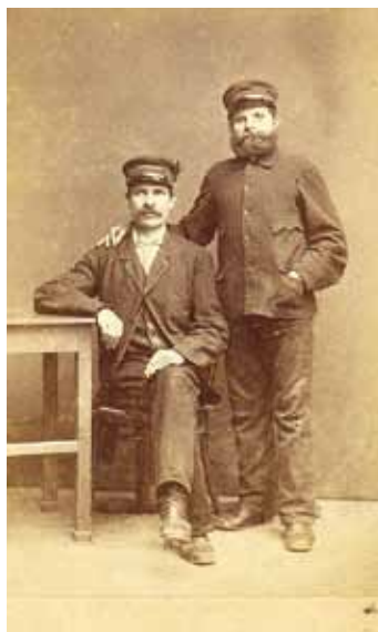
Rajhradští železničáři kolem r. 1870

Rajhradské nádraží vítalo prezidenta T. G. Masaryka při jeho cestách do Židlochovic, bylo očitým svědkem bojů o Holasice