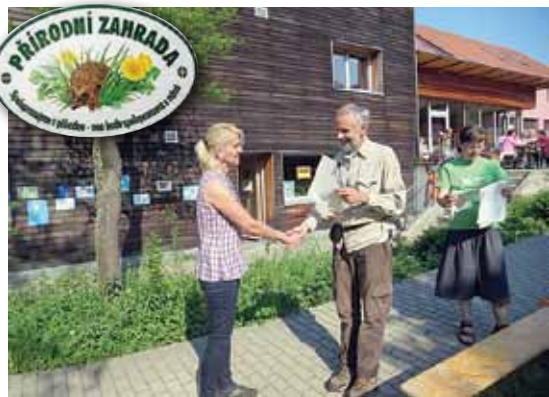
Předání plakety

Velký den a velká chvíle pro naši školu. Od 1. května 2014 se můžeme oficiálně pyšnit držitelstvím plakety Přírodní zahrada, která je udělována těm zahradám, které splňují kritéria šetrného hospodaření respektující ekologický přístup – zejména nepoužívání pesticidů, umělých hnojiv, rašeliny a dalších podmínek. Plaketa spolu s certifikátem byla slavnostně předána v centru Veronika