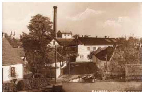
Areál továrny po roce 1933

Původně cukrovar, později továrna na klobouky, od 50. let minulého století výroba koberců. Dnes je budova využívána různými podnikatelskými subjekty