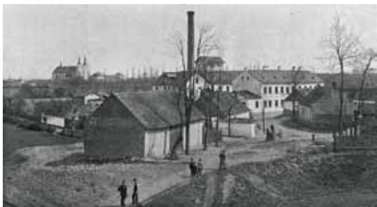
Továrna na klobouky v roce 1894

Na konci Tovární ulice v místech, kde stávaly domky č. p. 14–17, byl v letech 1849–1852 postaven akciový cukrovar. V této první rajhradské tovární budově se zrodila myšlenka založení Sboru dobrovolných hasičů v Rajhradě. To se psal rok 1883. Sbor měl původně německé velení, brzy však přešel k velení českému.