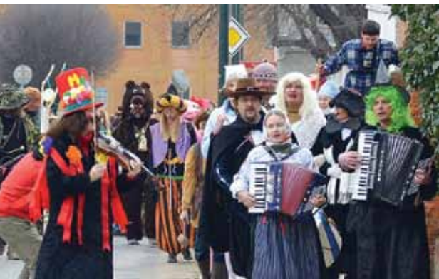
Masopustní průvod vykročil