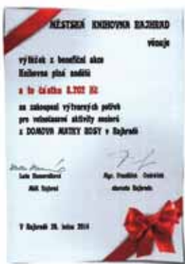
Certifikát benefiční akce