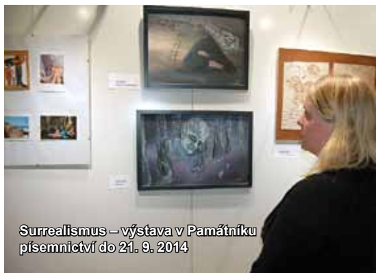
Surrealismus – výstava v Památníku písemnictví do 21. 9. 2014