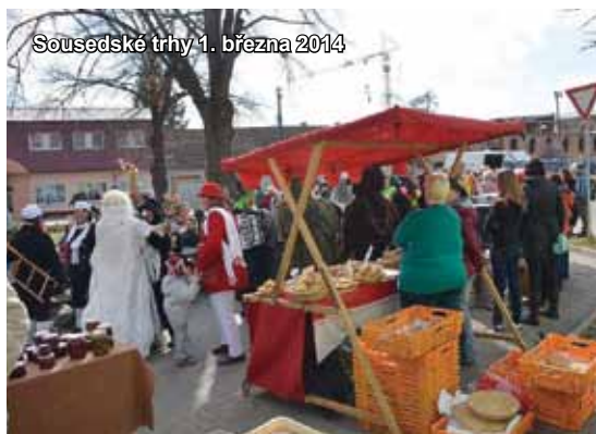
Sousedské trhy 1. března 2014