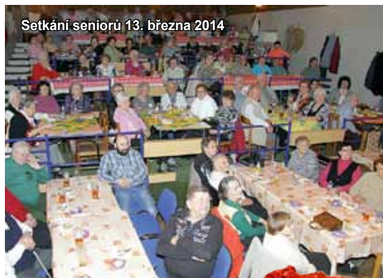
Setkání seniorů 13. března 2014

RAJHRADSKÝ ZPRAVODAJ • Informace o dění ve městě Rajhrad • 24. ročník • Vydavatel: město Rajhrad, Masarykova 32, 664 61 Rajhrad, www.rajhrad.cz • Redakční rada: Bc. Roman Svora – předseda, PhDr. Dagmar Malotová, Lada Hamerníková, podatelna@rajhrad.cz • Redaktor: Petr Žižka, zpravodaj@rajhrad.cz • Grafické zpracování: Roman Halouzka, CGS – reklamní studio, www.ReklamaProVas.cz • Uzávěrka 15. dne předcházejícího měsíce • Vychází zdarma každý sudý měsíc • Náklad 1 350 kusů • Nevyžádané rukopisy a přílohy se nevracejí • Registrační číslo MK ČR E 10274