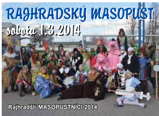
RAJHRADSKÝ MASOPUST sobota 1.3.2014