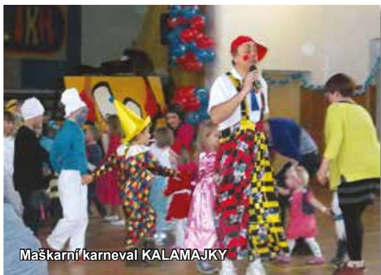
Maškarní karneval KALAMAJKY