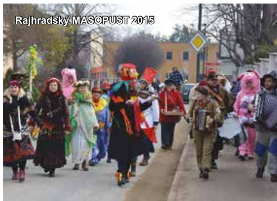
Rajhradský MASOPUST 2015