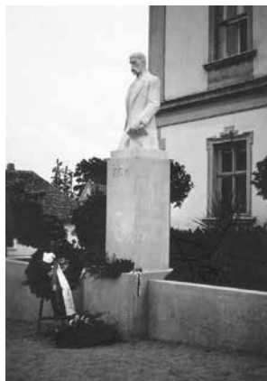
První pomník TGM z roku 1938