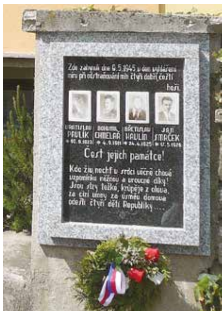
Tragická událost 9. 5. 1945