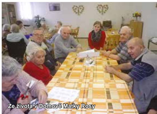
Ze života v Domově Matky Rosy