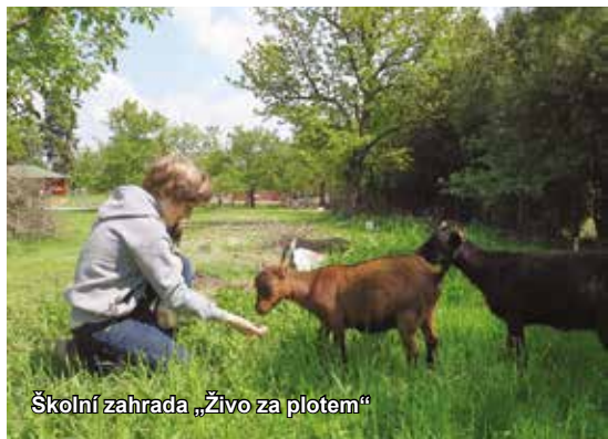
Školní zahrada „Živo za plotem“