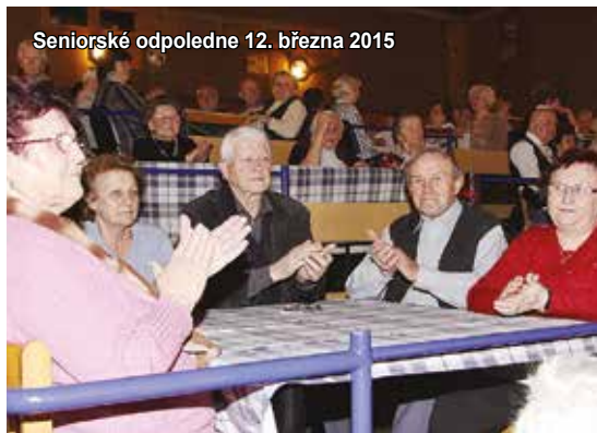
Seniorské odpoledne 12. března 2015