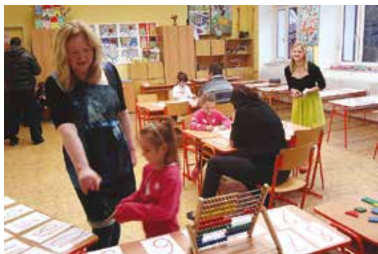
Zápis žáků do prvního ročníku

V úterý 10. 2. 2015 se konal zápis žáků do 1. ročníku. Zápis tentokrát proběhl ve třídách 1. stupně na budově Masarykova 96. Na různých stanovištích se ověřovaly schopnosti a dovednosti jednotlivých dětí. Budoucí prvňáčky po třídě provázely paní učitelky a žákyně vyšších ročníků základní školy. V případě potřeby se rodiče žáků mohli obrátit na pracovnice školního poradenského pracoviště – speciální pedagožku a psychologku. Většina dětí u zápisu prokázala, že nástup do školy pro ně nebude problém. Ke dni 10. března bylo zapsáno 62 dětí. Z toho bylo poprvé u zápisu 57 dětí a 5 dětí přišlo po ročním odkladu. Tento počet však není konečný, protože někteří rodiče konzultují s odborníky z pedagogicko-psychologických poraden možnost odkladu školní docházky u dětí o jeden rok a termín vyřízení odkladu je do 31. května.