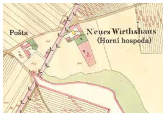
Císařský otisk 1825