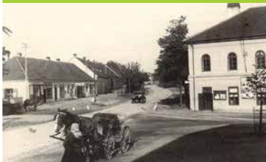
Křížovatka u radnice kolem roku 1930