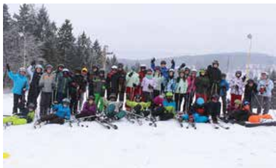
Lyžařský výcvikový kurz žáků ZŠ TGM Rajhrad