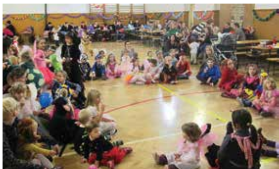
Dětský maškarní ples 2016