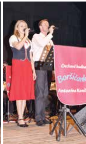
O hezké písničky nebyla nouze