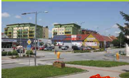
Křížovatka u radnice dnes

RAJHRADSKÝ ZPRAVODAJ • Informace o dění ve městě Rajhrad • 26. ročník • Vydavatel: Město Rajhrad, Masarykova 32, 664 61 Rajhrad, www.rajhrad.cz • Redakční rada: předsedkyně PhDr. Dagmar Malotová, členové Lada Hamerníková, Ing. Jiří Milek, mesto@rajhrad.cz , redaktor Petr Žižka, zpravodaj@rajhrad.cz • Grafické zpracování: Roman Halouzka, CGS – reklamní studio, www.ReklamaProVas.cz • Uzávěrka 15. dne předcházejícího měsíce • Vychází zdarma každý sůdý měsíc • Náklad 1 450 kusů • Nevyžádané rukopisy a přílohy se nevracejí • Registrační číslo MK ČR E 10274