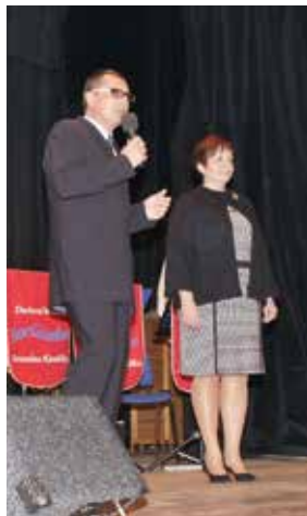
Zahájení seniorského odpoledne