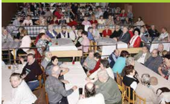
Setkání seniorů 2016