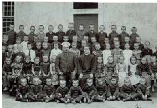
I. třída, školní rok 1904/1905

Díky našim milým rajhradským benediktinům se do rajhradského okresního archivu dostala sada šesti jedinečných fotografií žáků a učitelů místní obecné školy z konce školního roku 1904/1905. Na více než stoletých snímcích vidíme dívky a chlapce v dobových oděvech z Rajhradu, Holasice, Popovic a podle ústavních šatů snadno rozpoznatelné první chovance tehdy v Rajhradě otevřeného Moravského zemského sirotčince (dnes stará budova střední zahradnické školy). Postupně budeme v Rajhradském zpravodaji otiskovat všech šest fotografií se soupisem žáků podle dobových třídních výkazů. Všechny děti uvedené v třídních knihách ovšem na fotografiích být nemohou, protože se jejich stav během roku měnil. Některé děti přicházely, jiné odcházely, proto jsme kurzivou vyznačili ty, které podle třídních knih dokončily své školní ročníky. Podtržením jsme zvýraznili ty děti, které se přestěhovaly, byly přeřazeny do jiné třídy, předčasně ukončily docházku pro nevyzrálost nebo zemřely, a proto na fotografiích určitě nebudou. Nyní si vezměte do ruky pořádnou lupu a hledejte svého předka, podoba se i po sto letech určitě nezapře.