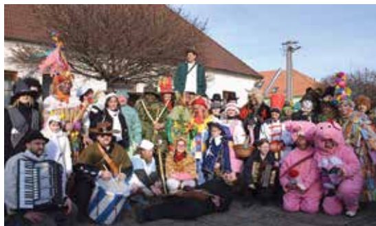
Rajhradský MASOPUST 2016