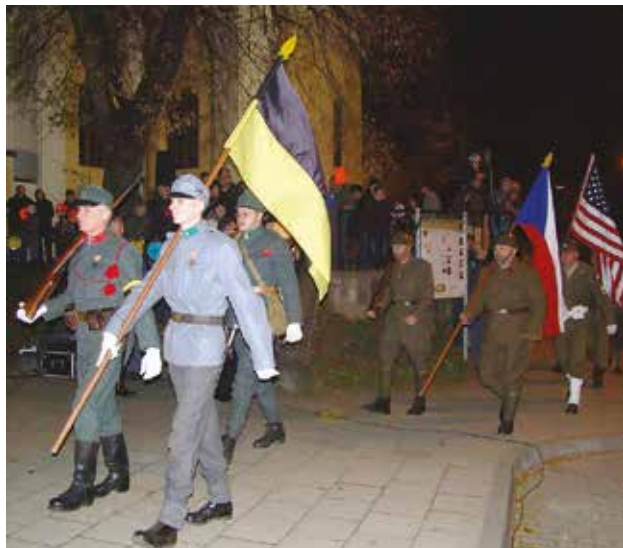
Čestná jednotka v historických uniformách