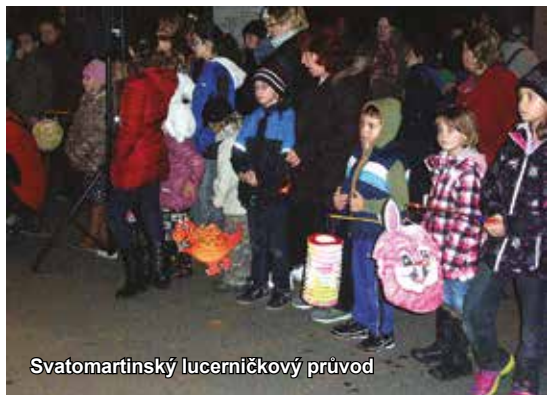
Svatomartinský lucerničkový průvod