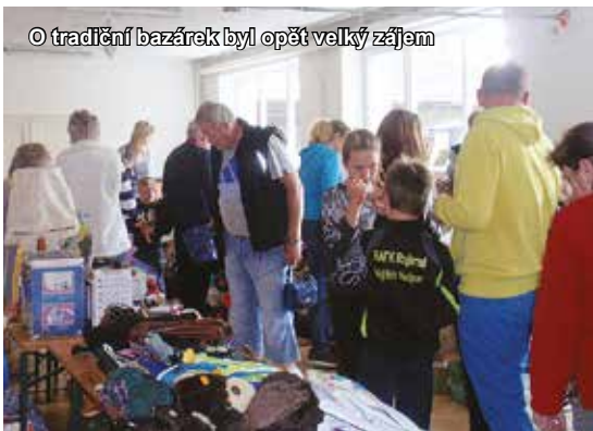
O tradiční bazárček byl opět velký zájem