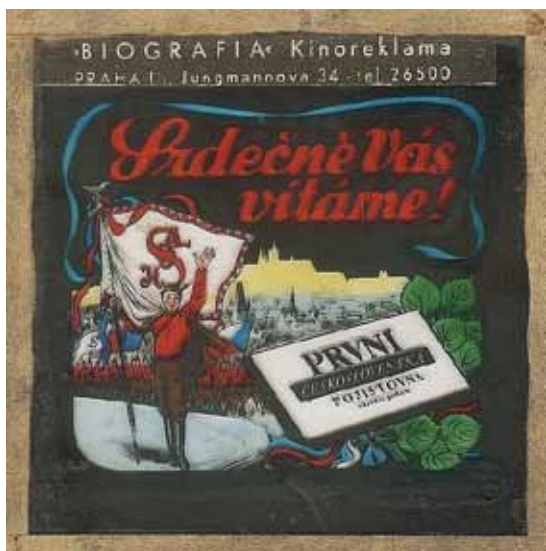
Sokolské kino vítá návštěvníky

Se stavbou sokolovny se začalo na podzim roku 1925. Členové sokolské jednoty dávali dary – když to nestačilo, musela si jednota vypůjčit. Stavba měla zajímavý postup, nejprve se postavila sborovna a byt sokolníka, následovaly šatny a tělocvična. Hned od počátku stavby se uvažovalo o promítání filmů. Dne 5. září v následujícím roce je do zdíva novostavby vložen pamětní kámen, ve kterém byly uloženy pergameny se stručnou historií Sokola Rajhrad s provoláním, které končí, cituji úryvek... přejme si, aby tato budova stala se sídlem opravdové, účinné lásky bratrské, jež dovede pomáhati i v dobách nejhorších, aby z ní vždycky šířilo se světlo pravdy, aby nikdy v ní nezaznělo slovo falše a zloby,... aby ideje Tyršovy a Fügnerovy staly se majetkem celého národa... Slavnostně byla sokolovna otevřena 29. května 1927 valnou schůzí jednoty s bohatým kulturním programem (jednota měla v té době vyspělý pěvecký sbor). Následujícího dne prošel Rajhradem sokolský průvod. Vlivem deštivého počasí neproběhlo veřejné cvičení na hřišti za sokolovnou v plném rozsahu. Den byl zakončen taneční zábavou v sokolovně.