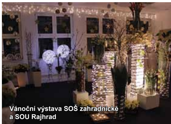
Vánoční výstava SOŠ zahradnické a SOU Rajhrad