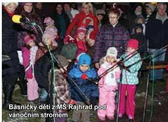
Básničky dětí z MŠ Rajhrad pod vánočním stromem