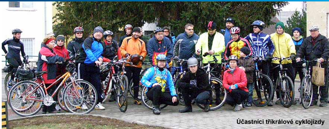
Účastníci tříkrálové cyklojízdy

Asi třicátka rajhradských i přespolních cyklistů se shromáždila v neděli 6. ledna v 10 hodin na tradičním místě před restaurací u Opla, aby vstoupili do nového roku 2013 oslavou společnou vyjíždkou. Po společném přípitku a s přáním „Ať nám to letos dobře šlape“ všichni vyrazili na již tradiční novoroční silniční trasu Rajhradice, Otmarov, Měnin, Blučina, Opatovice, Rajhrad. Počasí nám zprvu přálo, později se přidal drobný déšť, ale vzhledem k ročnímu období to bylo pořád skvělé počasí. Peloton