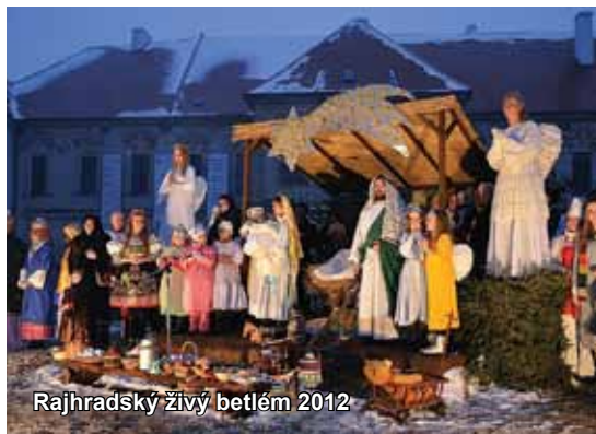
Rajhradský živý betlém 2012