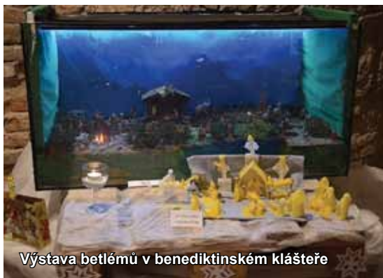
Výstava betlémů v benediktinském klášteře