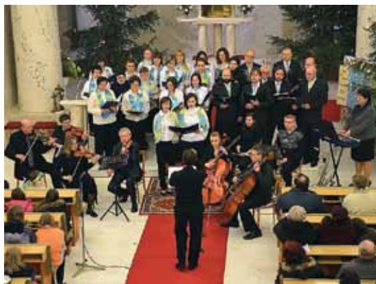
Rajhradský pěvecký sbor