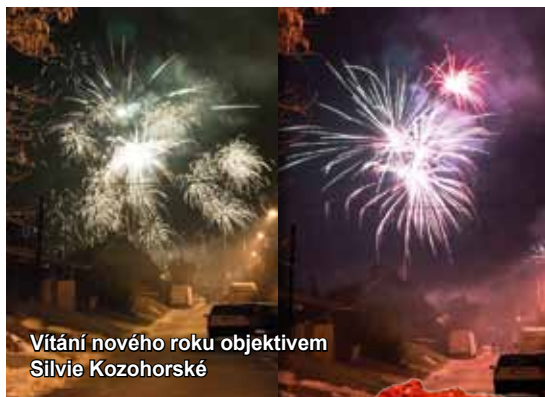
Vítání nového roku objektivem Silvie Kozohorské

RAJHRADSKÝ ZPRAVODAJ • Informace o dění ve městě Rajhrad • 23. ročník • Vydavatel: město Rajhrad, Masarykova 32, 664 61 Rajhrad, www.rajhrad.cz • Redakční rada: Bc. Roman Svora – předseda, PhDr. Dagmar Malotová, Lada Hamerníková, podatelna@rajhrad.cz • Redaktor: Petr Žížka, zpravodaj@rajhrad.cz • Grafické zpracování: Roman Halouzka, CGS – reklamní studio, www.ReklamaProVas.cz • Uzávěrka 15. dne předcházejícího měsíce • Vychází zdarma každý sudý měsíc • Náklad 1 300 kusů • Nevyžádané rukopisy a přílohy se nevracejí • Registrační číslo MK ČR E 10274