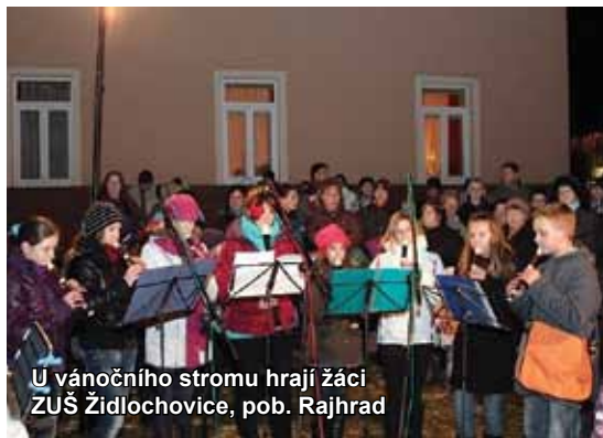
U vánočního stromu hrají žáci ZUŠ Židlochovice, pob. Rajhrad