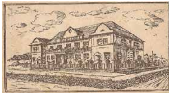
Projektová studie sokolovny

V období okupace se rajhradští sokolové zapojují do odbojové činnosti a do roku 1941, kdy je činnost Sokola násilně zastavena, se v sokolovně odehrávají tajné odbojářské schůzky. Po ukončení války se sokolský život plně rozvíjí, obnovuje se cvičení a ožívá i divadelní činnost.