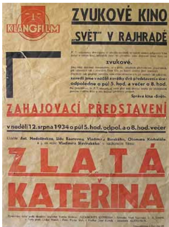
Plakát zvukového kina

Od roku 1927 žije sokolovna čilým ruchem. Všechny složky (ženské i mužské) začínají cvičit, zakládá se divadelní odbor, pilně cvičí pěvecký sbor, sokolská hudba a činnost zahajuje sokokolské kino Svět. Promítají se němé a od roku 1934 zvukové filmy. Věřte – nevěřte, na filmová představení začínají jezdit i lidé z Brna. Proč? – no proto, že v Rajhradě doprovází promítání filmů malý orchestr (bylo to velmi nezvyklé, protože většinou byly němé filmy doprovázeny hrou na klavír, nebo klavírním triem: klavír, housle violoncello). Sokolovna se postupně rozšiřuje o jeviště a přístavbu, ve které se v současné době schůzují, hrají šachy a pod. Provoz zvukového filmu byl zahájen 12. srpna 1934 uvedením českého filmu Zlatá Kateřina. Kino, nejprve sokolské, po ukončení světové války státní (pod správou MNV Rajhrad), se v roce 1958 přeneslo do budovy bývalé orlovny, ve které je dnes RESTAURACE NA KINĚ, Městská knihovna Rajhrad (od roku 1959) a Biliárd Club jednoty Orla Rajhrad.