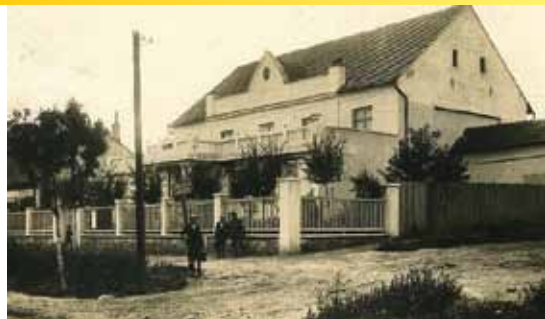
Sokolovna v roce 1934

Rajhradská sokolovna, dům, ve kterém se stále cvičí a tančí na bálech, ale v minulosti se v ní hrála divadla, dělaly se výstavy a promítaly se tam také filmy