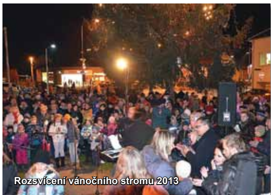
Rozsvícení vánočního stromu 2013