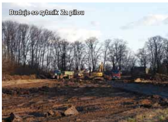
Buduje se rybník Za pilou