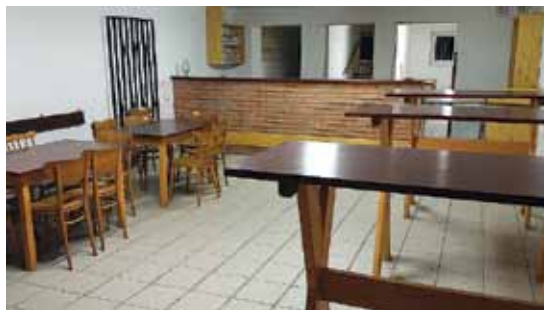
Společenské zázemí sokolovny

Jak už to při opravách a rekonstrukcích starších objektů bývá, při projekčních pracích a při stavbě samotné se objevily další komplikace. Nejvýznamnější se týkala historického vstupního portálu, kde došlo k poklesu základů a následně vzniku trhlin ve zdivu pod betonovými sokly nesoucími dvě dvojice sloupů podpírajících stříšku zastřešující vchod.