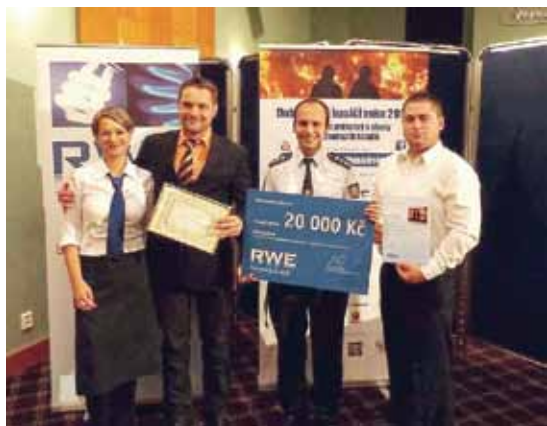
Cena za 2. místo v soutěži RWE dobrovolní hasiči 2013

Obrovským úspěchem při výběru odbornou porotou skončil náš postup do finále v celorepublikové soutěži RWE dobrovolní hasiči roku 2013 a získáním ocenění za 2. místo v této soutěži, včetně finančních a věcných darů.