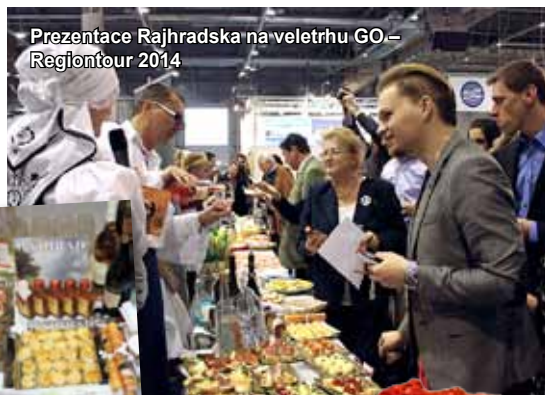
Prezentace Rajhradska na veletrhu GO- Regiontour 2014

RAJHRADSKÝ ZPRAVODAJ • Informace o dění ve městě Rajhrad • 24. ročník • Vydavatel: město Rajhrad, Masarykova 32, 664 61 Rajhrad, www.rajhrad.cz • Redakční rada: Bc. Roman Svora – předseda, PhDr. Dagmar Malotová, Lada Hamerníková, podatelna@rajhrad.cz • Redaktor: Petr Žižka, zpravodaj@rajhrad.cz • Grafické zpracování: Roman Halouzka, CGS – reklamní studio, www.ReklamaProVas.cz • Uzávěrka 15. dne předcházejícího měsíce • Vychází zdarma každý sudý měsíc • Náklad 1 300 kusů • Nevyžádané rukopisy a přílohy se nevracejí • Registrační číslo MK ČR E 10274