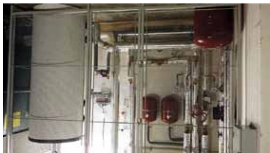
Zařízení pro moderní plynové vytápění

Považují za velmi důležité zdůraznit, že vedení TJ Sokol Rajhrad si plně uvědomuje, že pouze podpora města Rajhrad umožňuje fungování TJ Sokol Rajhrad a zajišťování podmínek jak pro sportovní činnost v Sokole Rajhrad, tak i k využívání sokolovny pro konání společenských akcí. Kromě podpory v oblasti oprav a rekonstrukcí je to významná podpora i v oblasti provozních nákladů.