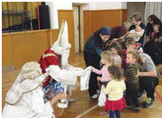
Mikuláš rozdává dobroty