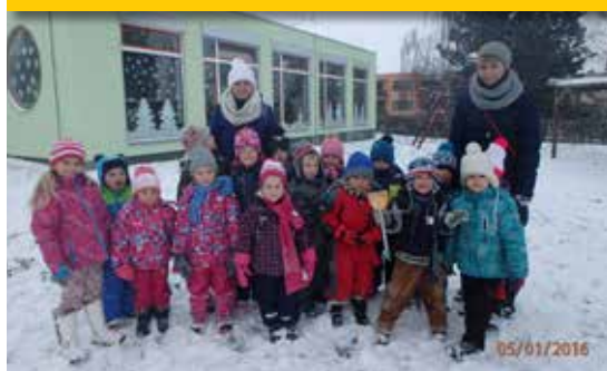
Letošní zima v Mateřské škole