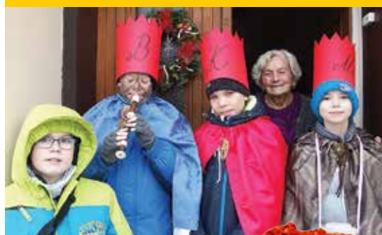
Tříkrálová sbírka 2016

RAJHRADSKÝ ZPRAVODAJ • Informace o dění ve městě Rajhrad • 26. ročník • Vydavatel: město Rajhrad, Masarykova 32, 664 61 Rajhrad, www.rajhrad.cz • Redakční rada: předsedkyně PhDr. Dagmar Malotová, členové Lada Hamerníková, Ing. Jiří Milek, podatelna@rajhrad.cz , redaktor Petr Žižka, zpravodaj@rajhrad.cz • Grafické zpracování: Roman Halouzka, CGS – reklamní studio, www.ReklamaProVas.cz • Uzávěrka 15. dne předcházejícího měsíce • Vychází zdarma každý sudý měsíc • Náklad 1 450 kusů • Nevyžádané rukopisy a přílohy se nevracejí • Registrační číslo MK ČR E 10274