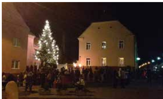
Rajhradský vánoční strom 2015