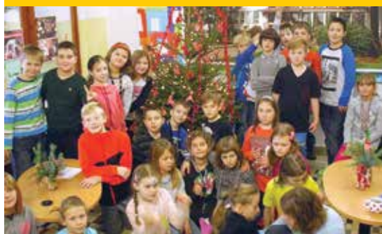
Žáci z chovatelského kroužku u vánočního stromečku