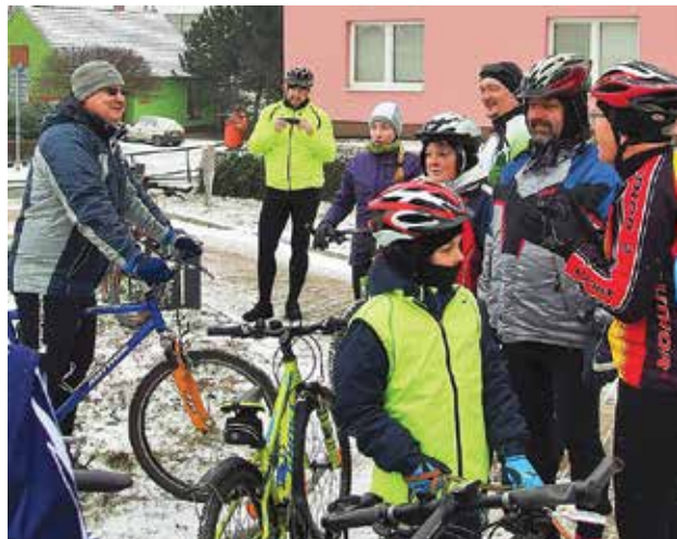
Porada před startem