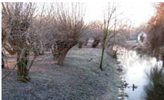
Romantické zákoutí u ramene řeky Svratky