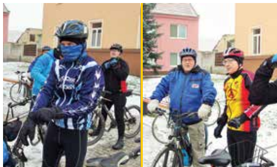
Novoroční cyklojízda 2016